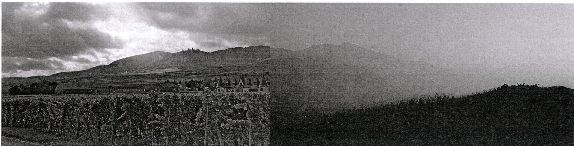
Schéma de Cohérence Territoriale Colmar Rhin Vosges

SCoT approuvé par délibération du comité syndical le 14 décembre 2016