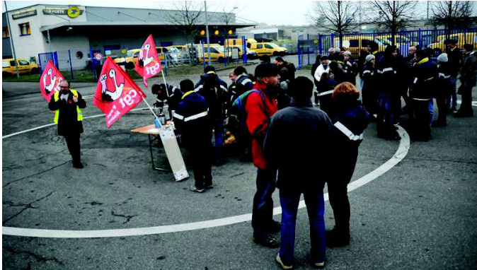
La manifestation s'est déroulée dans le calme et la convivialité.

Une soixantaine de postiers a manifesté son mécontentement devant le centre de tri de Colmar, hier en fin d'après-midi. Ils dénoncent les mauvaises conditions de travail dans l'entreprise (lire DNA du 6 décembre).